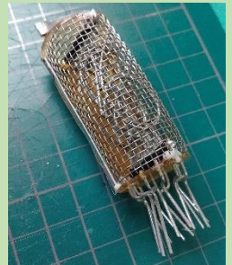
図8: 組み立てた内部部品

作成したニキシー管模型の内部をプラスチックの小瓶に入れる方法だが、底をいったん切り取って内部部品を入れたのち、接着剤で底を張り付けるという「偽ボトルシップ方式」で作成した。しかし、最終的に組み上げた際に、瞬間接着剤の使い過ぎによる白化が起きてしまい、中が見づらくなってしまった。これはエタノールを吹き付けることで白化したところを除去できるようなので、液体アルコールスプレーを吹き付けることにより多少解決した。