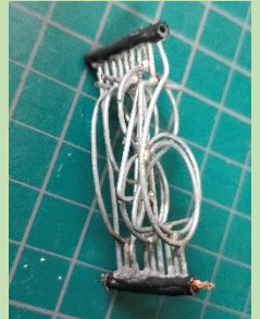
図5: 数字部分の組み立て